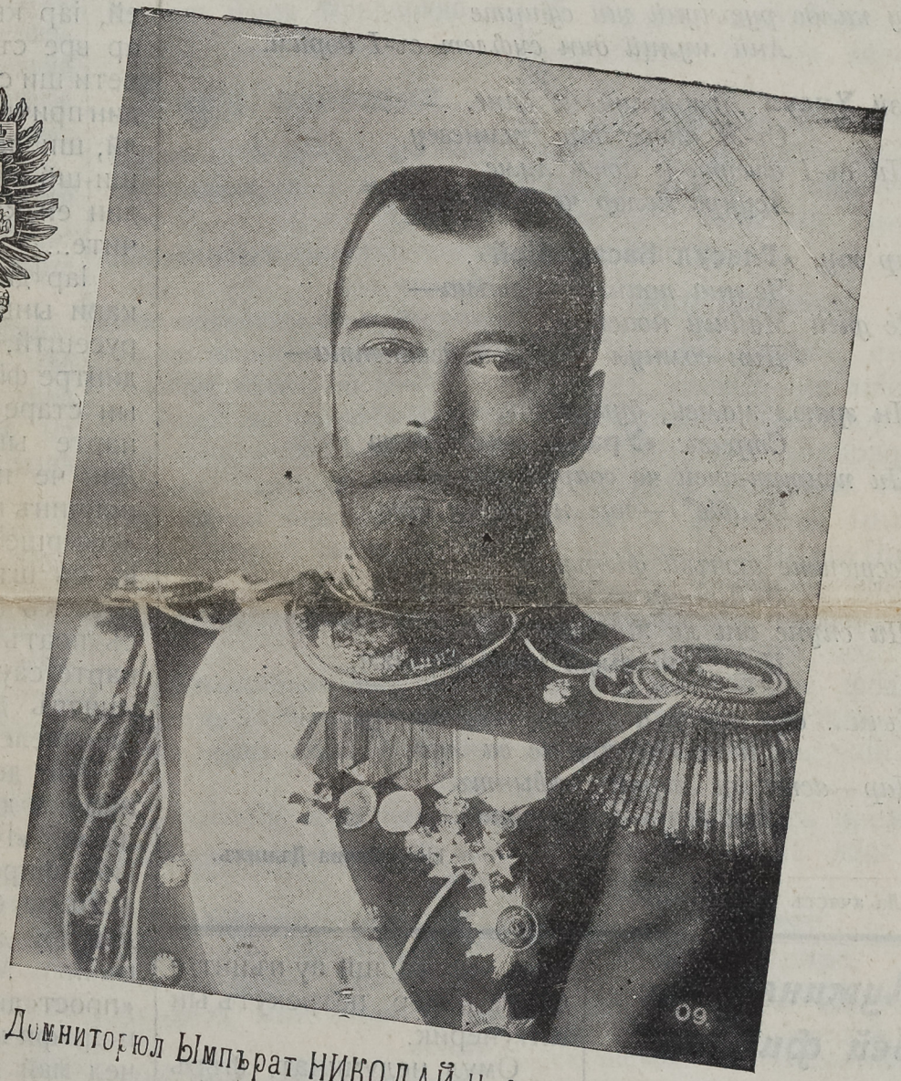
Домнитоарюл Ымпѣрат НИКОЛАЙ II АЛЕКСАНДРОВИЧ.

„Сей день, его же сотвори Господь, возра- дуемся и возвеселимся въ оны“.