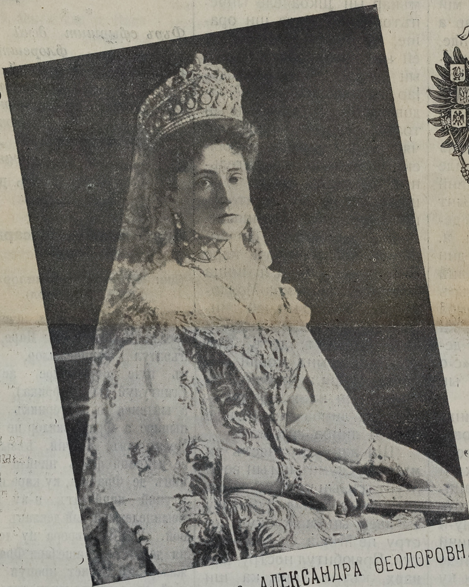
Ымпърътяса Доамна АЛЕКСАНДРА ФЕОДОРОВНА.