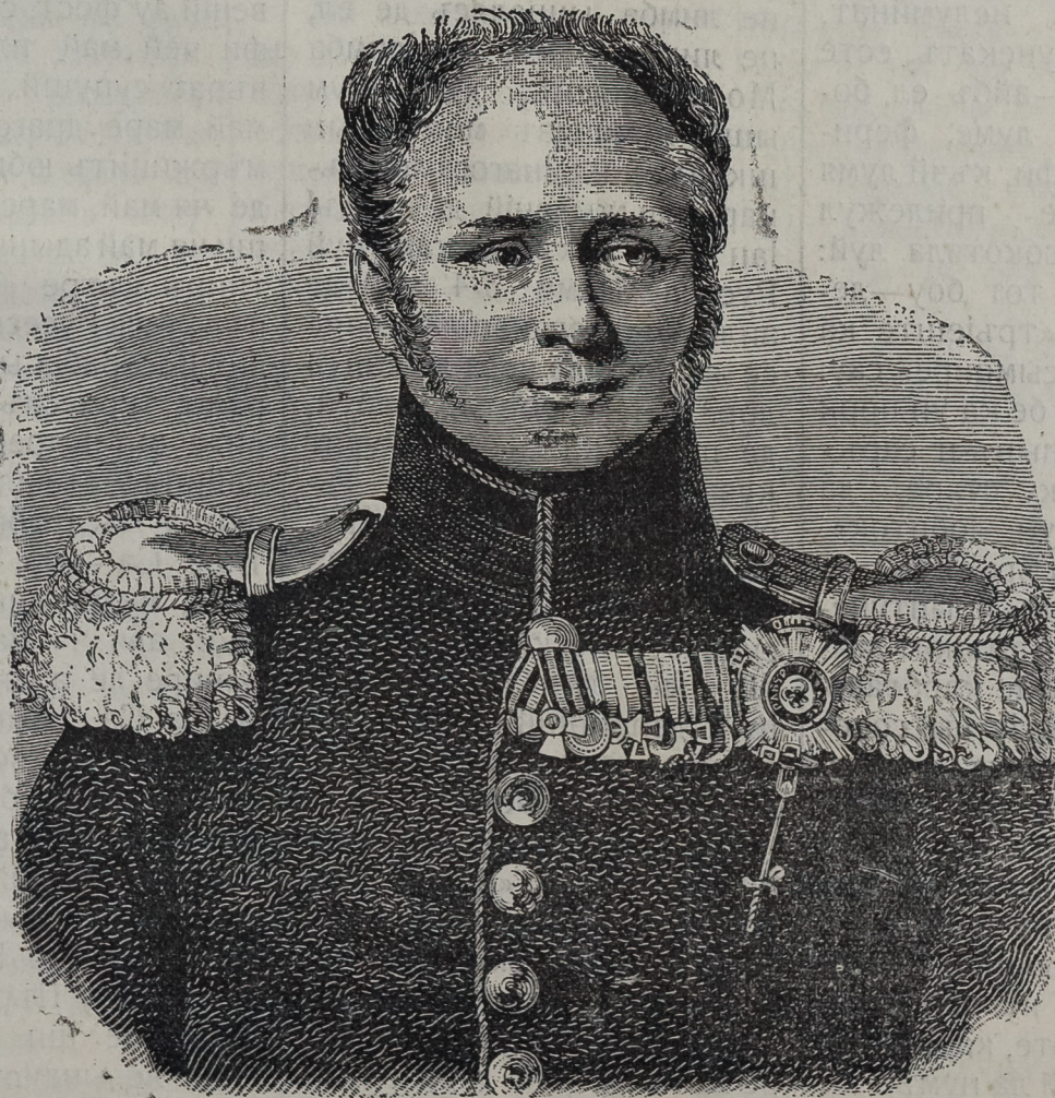
Репосатул ынтру Домнул Ымпѣратул Александру I Благословитул.

„Ачяста есте зіуа, пре каре ау фъкут-о Домнул, съ не букуръм ши съ не весе- лим ын я.“